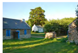
Kergallic est pour chacun un champ libre, l'amorce de son propre sentier.