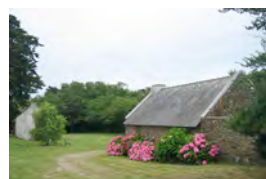
Un lieu privilégié pour se ressourcer dans un cadre à la fois simple, familial et chaleureux.