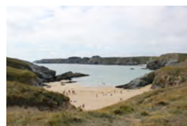
Une plage à vingt bonnes minutes de marche ; nombreuses et belles promenades sur la Côte sauvage. Location de vélos possible.