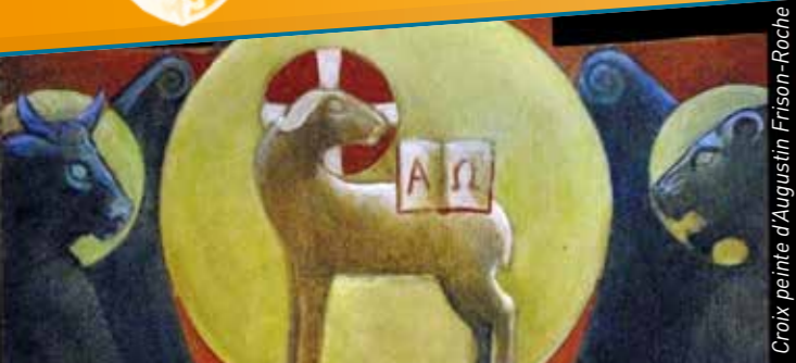
Croix peinte d'Augustin Frison-Roche